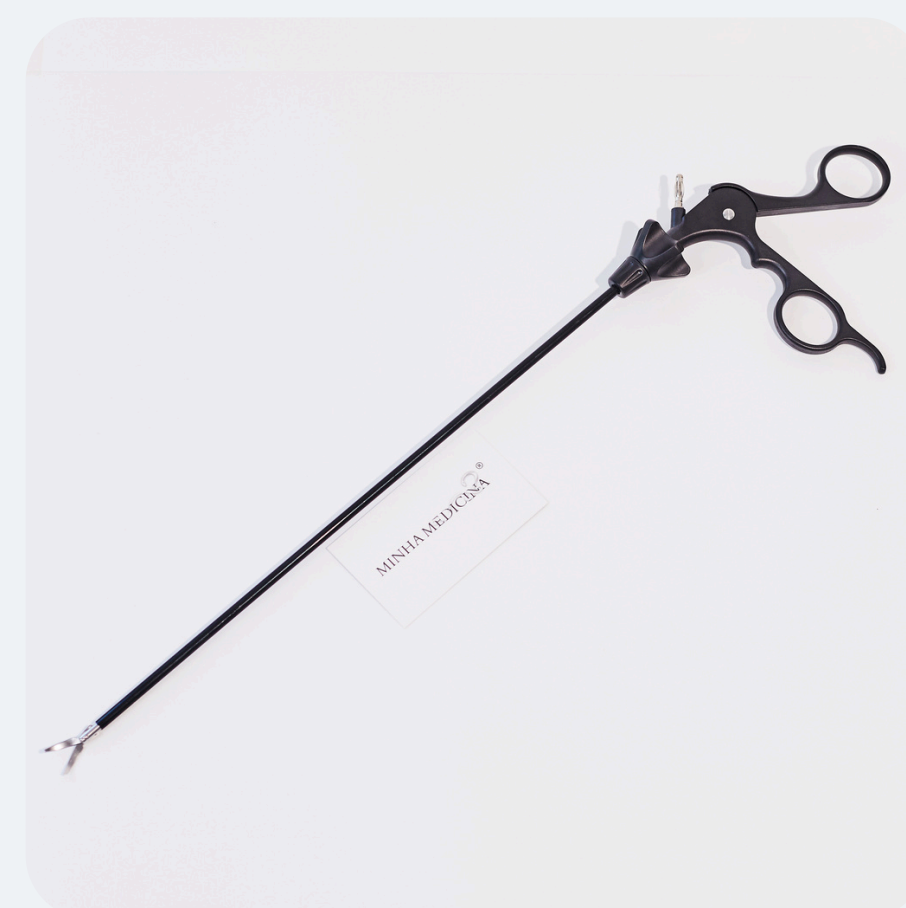
Tesoura Metzenbaum R$ 799,50