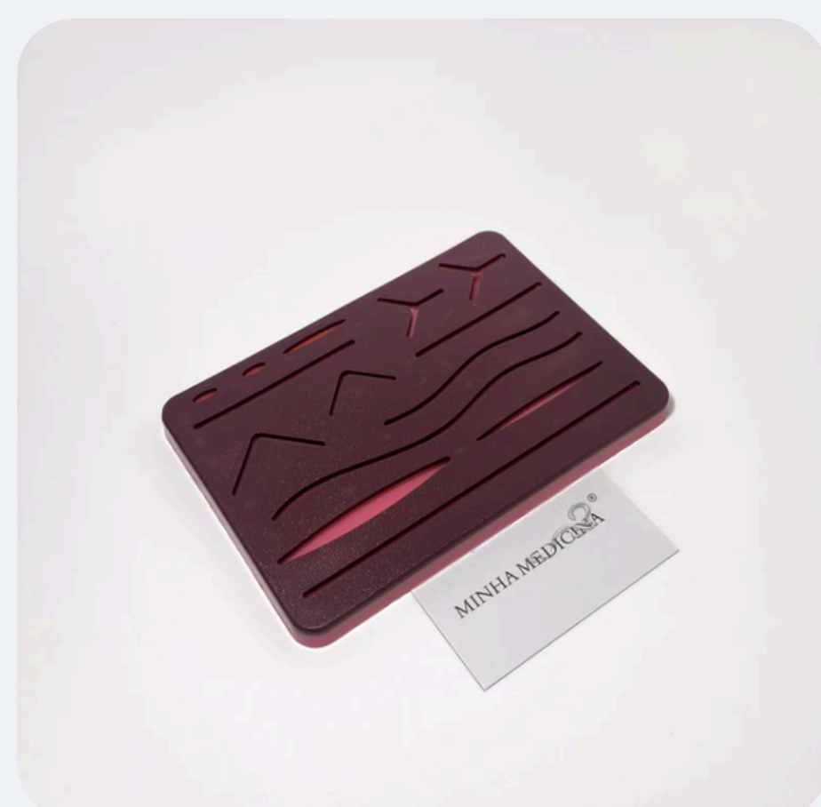
Simulador pele preta