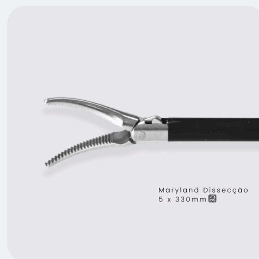
Maryland Dissecção R$ 799,50