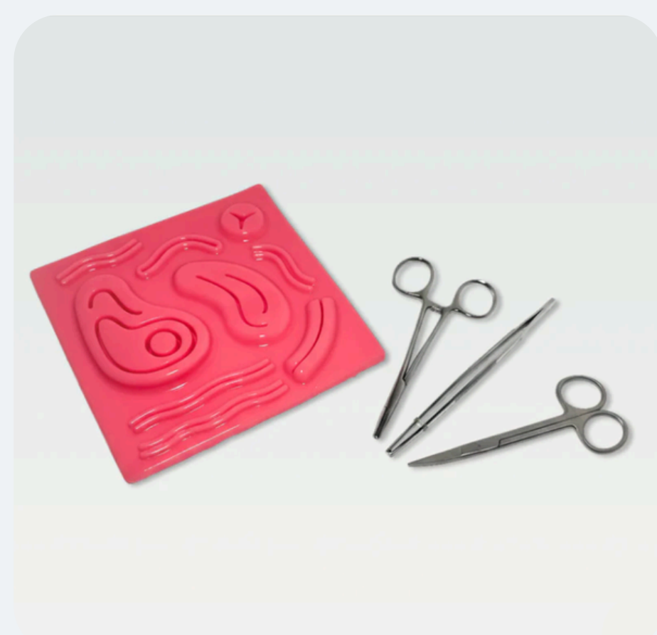
Kit Simulador dinâmico 3D