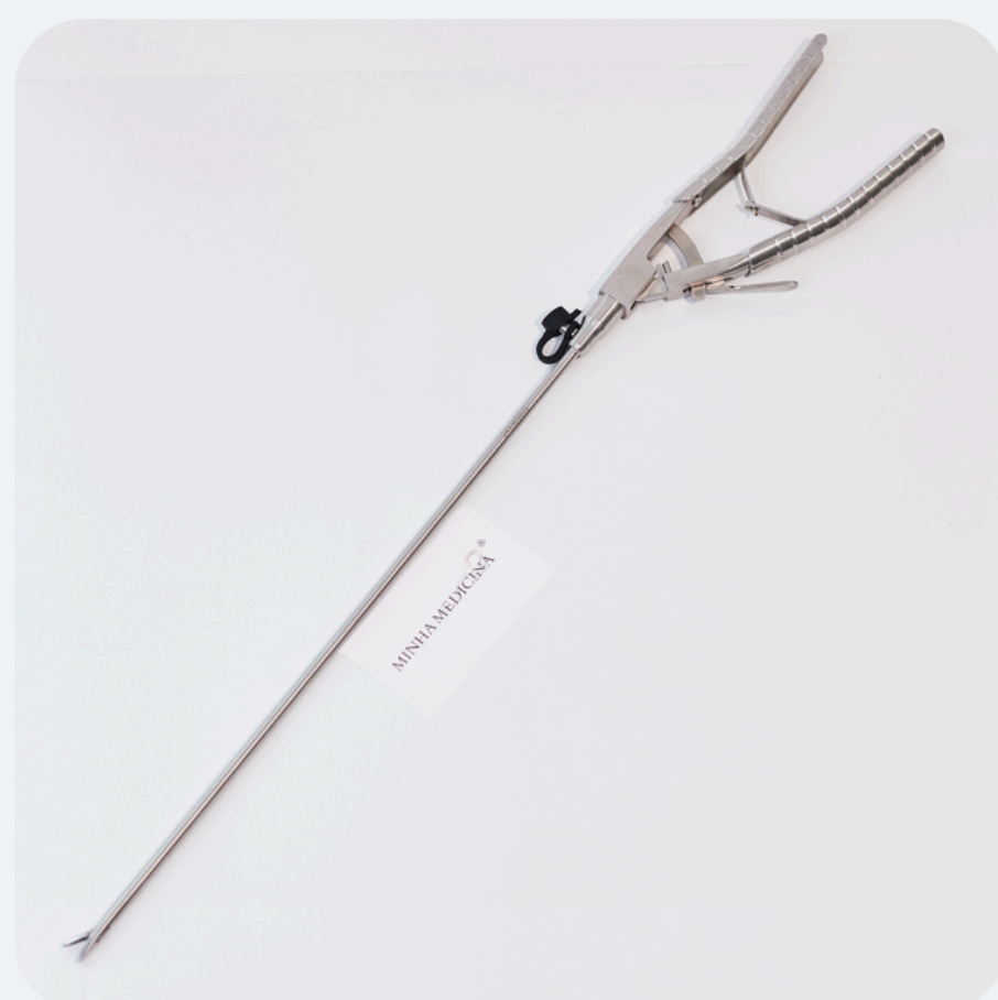
Porta Agulhas R$ 899,50