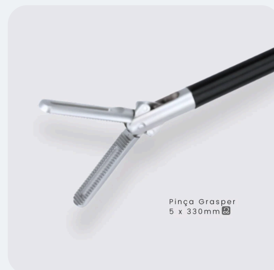
Pinça Grasper Fenestrada R$ 799,50