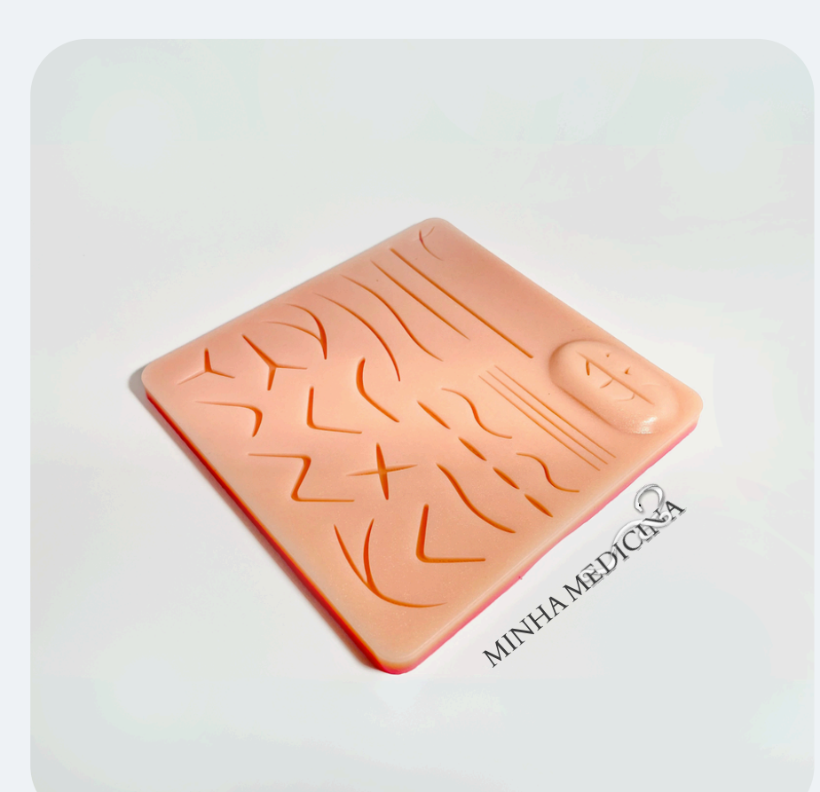
Simulador Avançado 3D